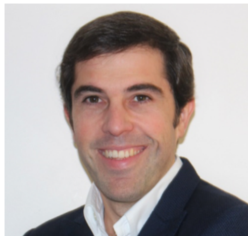
Ricardo Jorge Dinis-Oliveira 1,2,3